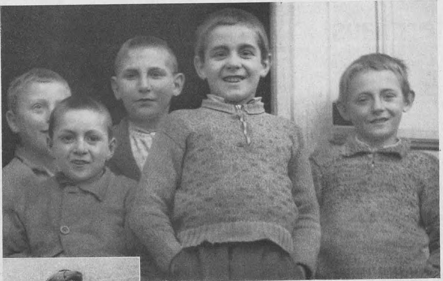
Froh sind diese fünf, dass die Schule aus ist und sie sich draussen tummeln und ganz sich selber sein können. Freiheit ist auch ihnen höchstes Gut.