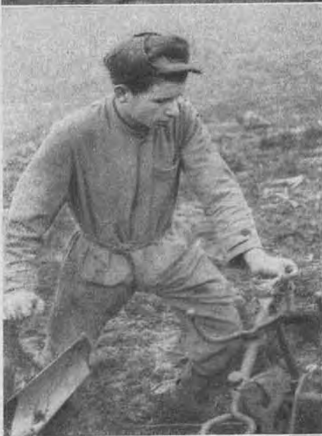
Berechtigter Stolz erfüllt den Jungen, darf er doch jetzt selber den Pflug führen. Das gibt Selbstbewusstsein und doppelte Freude an der Arbeit.

Voll Befriedigung verrichten diese Knaben die Feldarbeit, können sie doch die Arbeit übernehmen für die Männer, die an der Grenze sind. Um Fehler zu verhüten, wird die Arbeit streng überwacht, aber rasch werden die Knaben selbständige Ackermänner. Ochsen ersetzen hier die eingerückten Pferde.