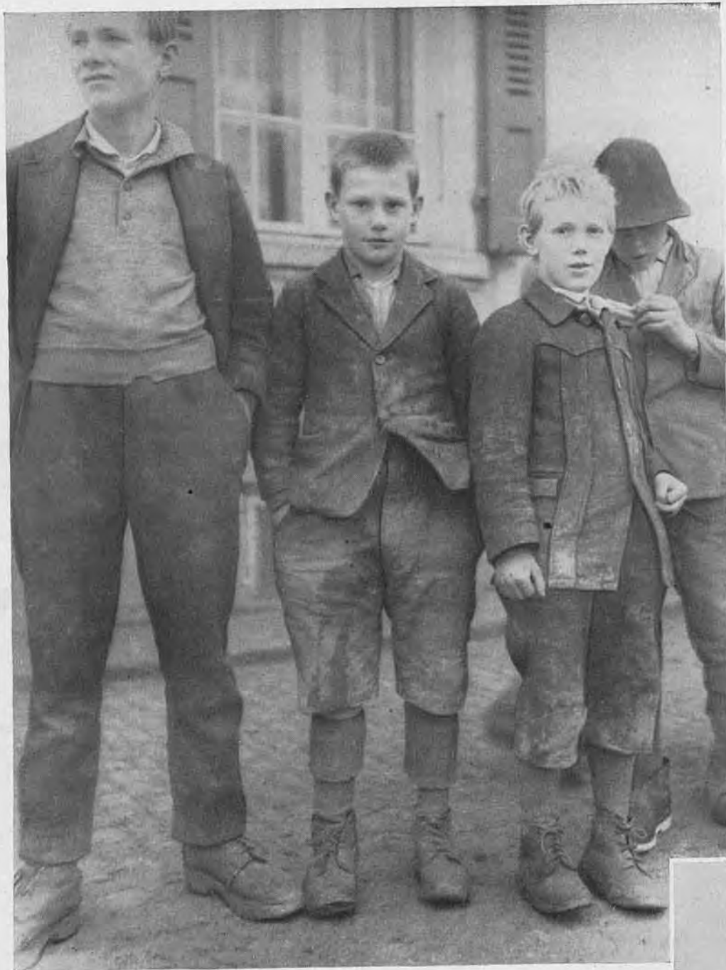
Im Knabenerziehungsheim Oberbipp. Alle Arbeiten werden vor Beginn besprochen, damit alle wissen wie und warum das so gemacht werden muss. So wie die Aufmerksamkeit ungleich ist, so ist auch der Erfolg verschieden. Oberstes Ziel ist es, allen die Arbeit zur Freude zu machen.

Es war fast wie an einem Markttag. Man ging herum, betrachtete die Kinder von oben bis unten, die weinend oder verblüfft dastanden, be-